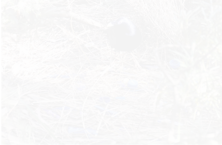
Summ, licencja: CC BY-SA 3.0